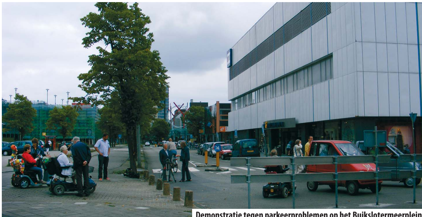
Demonstratie tegen parkeerproblemen op het Buikslotermeerplein

Enkele jaren geleden is besloten dat er ook in Amsterdam Noord op het centrale winkelplein – het Buikslotermeerplein – betaald zal moeten worden voor het parkeren. Op dit moment zijn het plein en omgeving in ontwikkeling – het winkelcentrum wordt geheel vernieuwd en er komt veel nieuwbouw bij. Er zullen ook parkeergarages bij gebouwd worden.