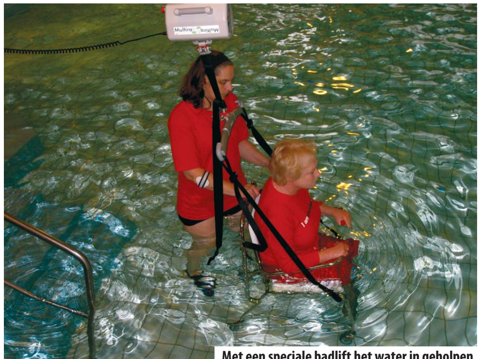
Met een speciale badlift het water in geholpen

Overigens is de toegankelijkheid van het Zuiderbad maar één van de doelen waarvoor de Werkgroep Toegankelijkheid Oud-Zuid (WTOZ) zich heeft ingespannen. Daarnaast wordt ook ingezet op de toegankelijkheid van de openbare ruimte, van gebouwen, horeca en winkels. Want: “mensen met een functiebeperking moeten zo volwaardig mogelijk kunnen meedoen aan de samenleving”.