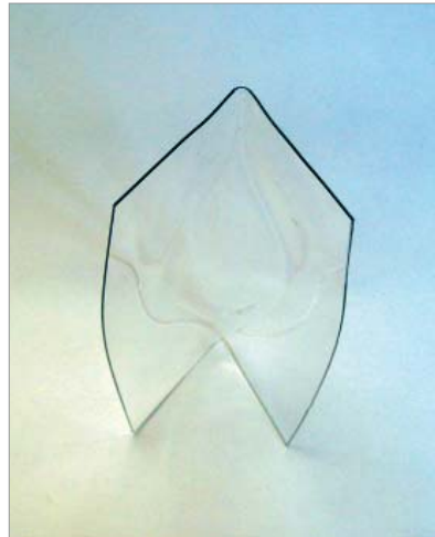
De Amsterdamse Pluim ontworpen door Bart Weggeman

In het viscentrum aan de Molenweg in Abcoude kunnen mensen met een beperking en zestigplussers het hele jaar door vissen vanaf