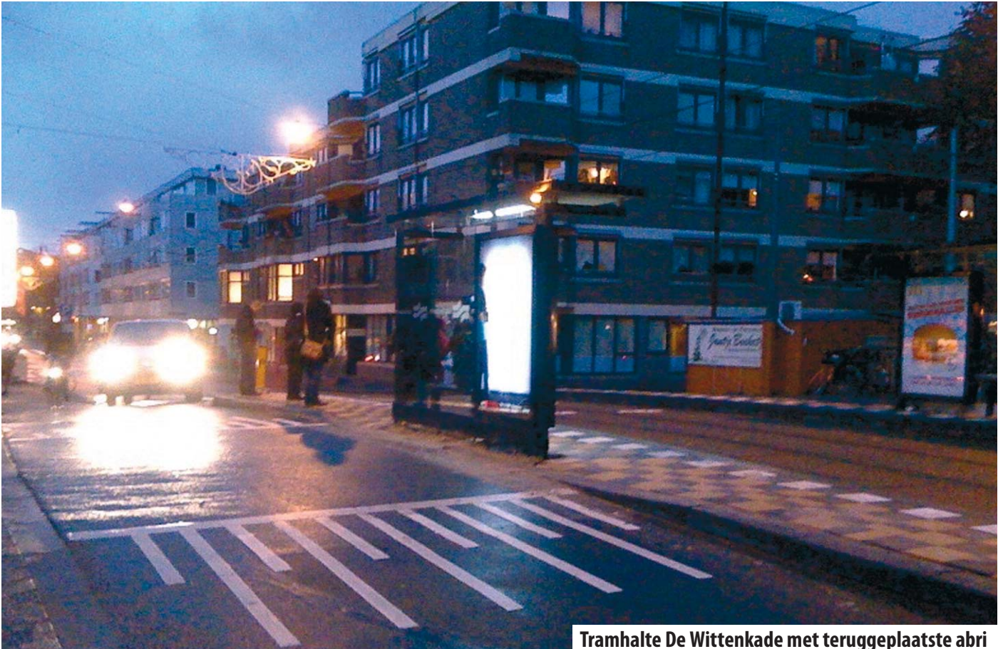
Tramhalte De Wittenkade met teruggeplaatste abri

Ongeveer anderhalf jaar geleden kwam er een klacht binnen van een bewoner uit Westerpark die niet met zijn rolstoel de tram in kon komen. Het Stadsdeel vroeg daarop aan de Gehandicapten Adviesraad Westerpark (GAW) welke tramhalte als eerste zou moeten worden aangepast. Hierop antwoordde de GAW dat de tramhalte De Wittenkade de voorkeur heeft. Want deze halte is niet alleen dichtbij voor de klager maar ligt ook vlakbij De Koperen Knoop, een ouderencentrum en de locatie van het loket Zorg en Samenleven. Bovendien wordt daar in de toekomst een Wijkservicebuurt gerealiseerd.