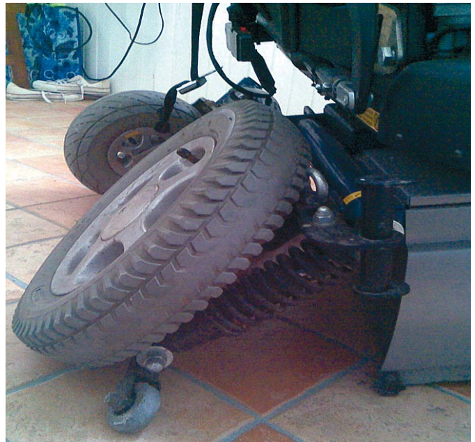
De linker onderkant finaal afgebroken

Je bent al gehandicapt en afhankelijk van een rolstoel en dan krijg je ook nog eens van dit ondeugdelijk materiaal geleverd. Dit ongeluk staat niet op zichzelf. Afgelopen najaar was ik onder-