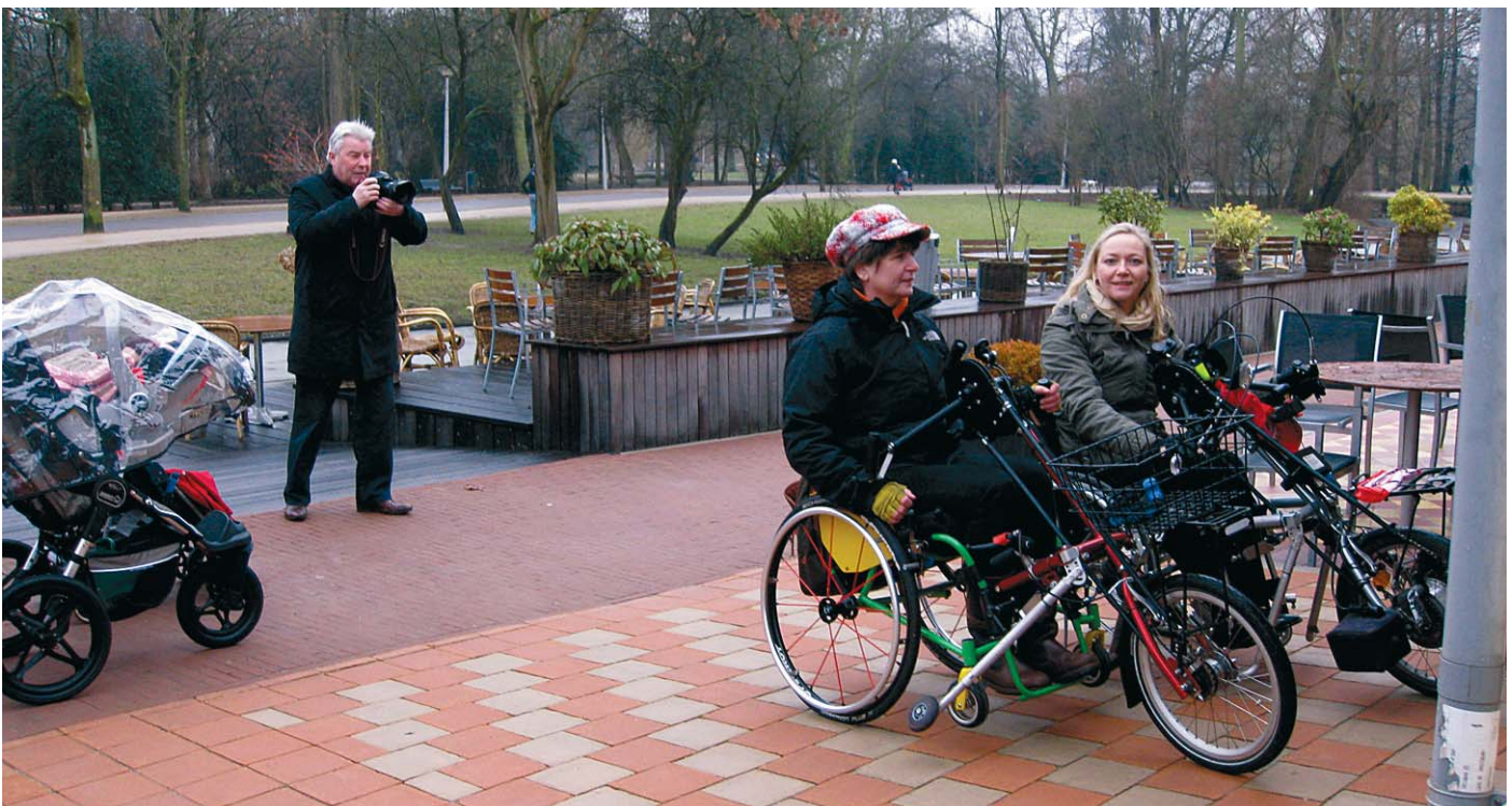
“Het Groot Melkhuis is fantastisch geworden...”

Zie voor het advies van WTOZ: http://toegankelijkheid.wocvondelpark.nl (via linkermenu > Advies WTOZ)